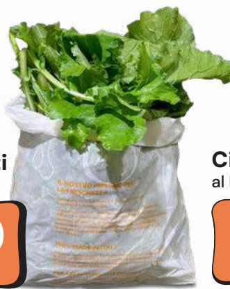
Broccoletti al hg