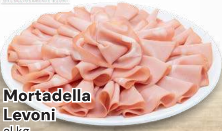
Mortadella Levoni al kg