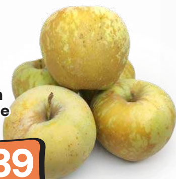
Mele Golden Ruggine al kg