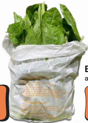
Spinaci al hg

VERDURE FRESCHE E PULITE CONFEZIONATE DA NOI CON BUSTA DI CARTA SALVA FRESCHEZZA