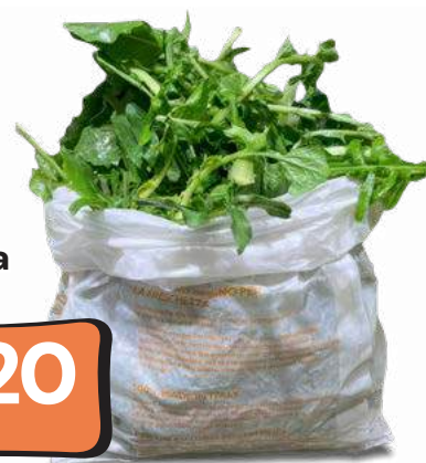
Cicoria al hg